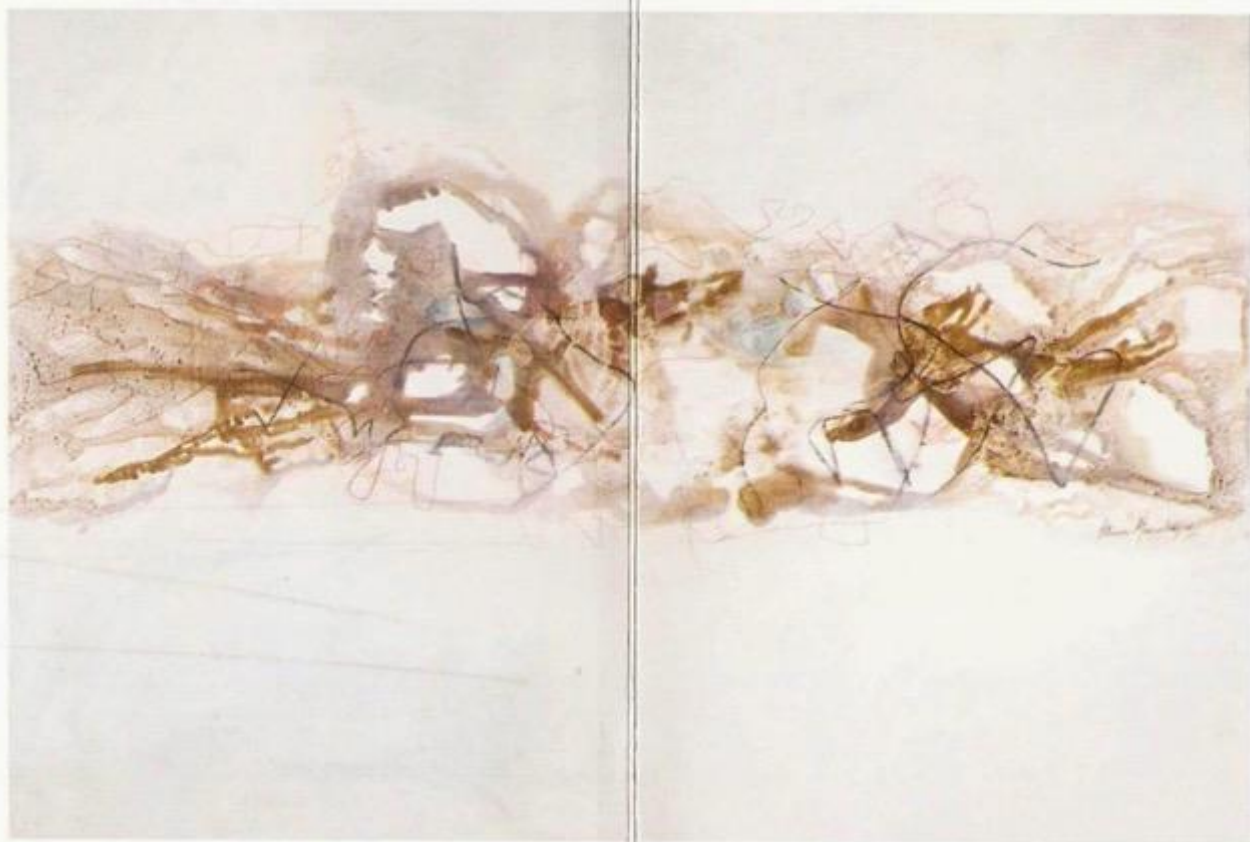
Pintada de blanco, 250x250 cm. Mixta sobre tela, 2008