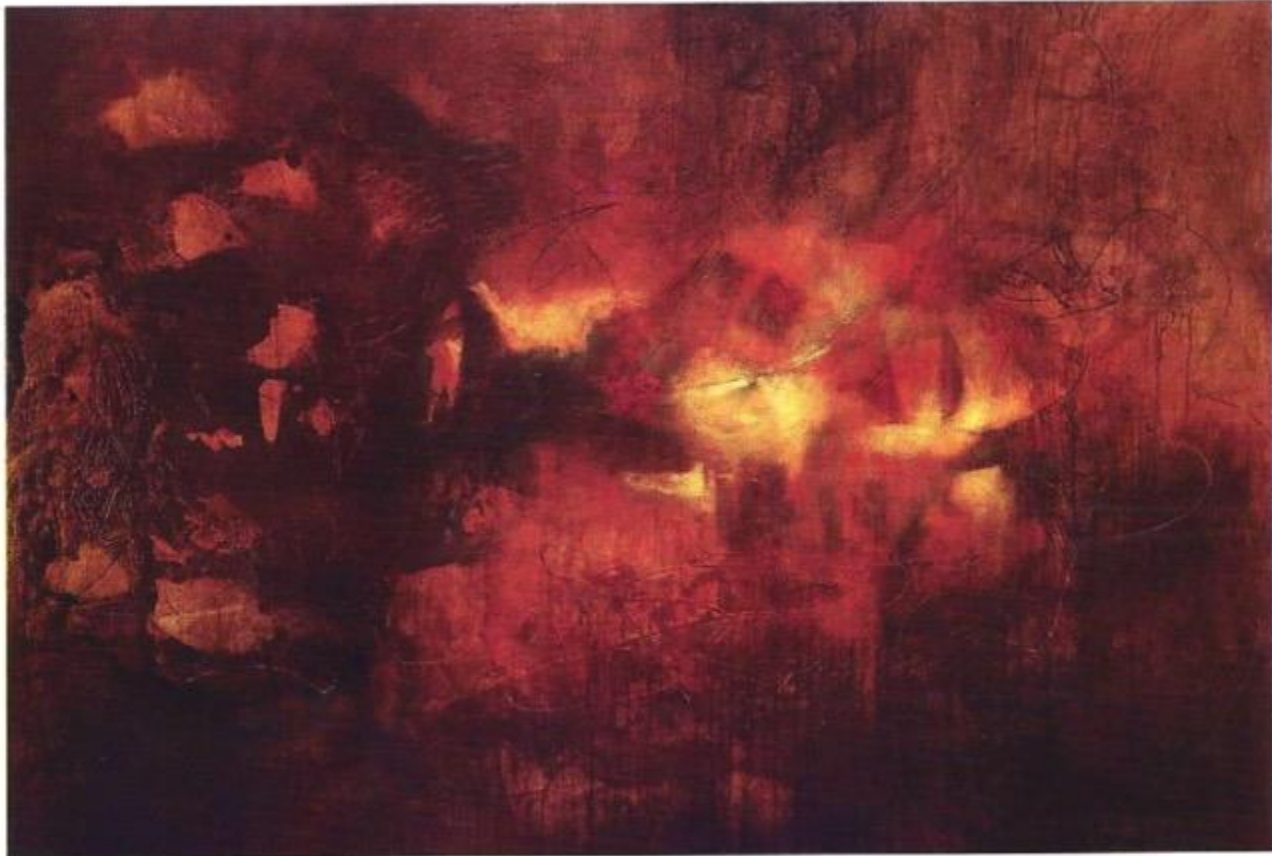
Referencias, 200x155cm. Mixta sobre tela, 2008